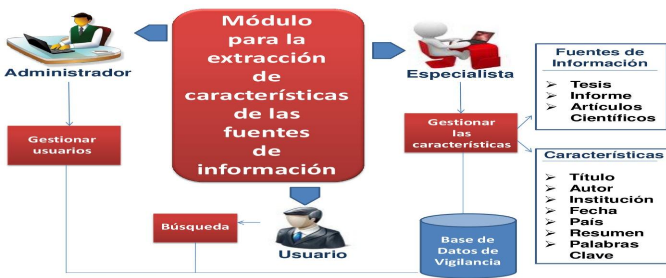
Figura 1. Esquema del módulo para la extracción de características de las fuentes de información.

Esto le permitirá al especialista, revisar las características antes de ser guardadas en la base de datos. Para que el usuario pueda buscar los agrupamientos naturales de las fuentes de información por esos indicadores.