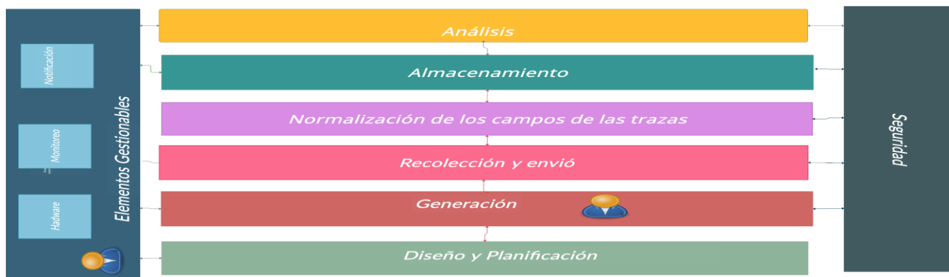
Figura 2 Componentes general de la arquitectura para la detección de violaciones a políticas de seguridad

normas y guías de buenas prácticas. Como se describe en la figura 2.1 la arquitectura se ha dividido en cinco capas (generación, recolección y envío, normalización, almacenamiento, análisis, visualización de información y monitoreo).